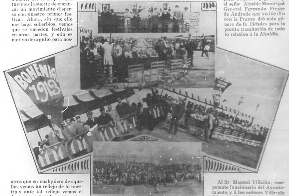
Comisión de recibo.—Mesa conteniendo los 15,000 juguetes.—Un aspecto de la tribuna y otro general del Malecón.

para adquirir juguetes y al señor Alcalde Municipal General Fernando Freyre de Andrade que se solicitó con la Prensa dió todo género de facilidades para la pronta tramitación de todo lo relativo á la Alcaldía.