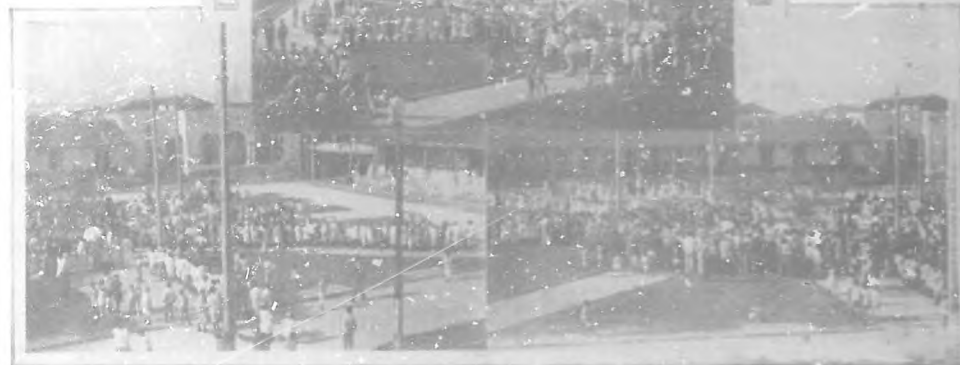
Festival infantil de "Bohemia" en Regla.—Varias secciones del Parque de la fiesta, vista en los momentos de ser distribuidos entre los niños de las Escuelas Públicas los 750 juguetes donados al efecto.

Dejamos que hablé el colega, el cual puede decir lo que dicho por nosotros pudiera autojorséle a alguien dicho por nosotros en hacer el comentario más fácil, y así que pueda leer la candelilla del señor Coyula poco a tiempo de que desde su