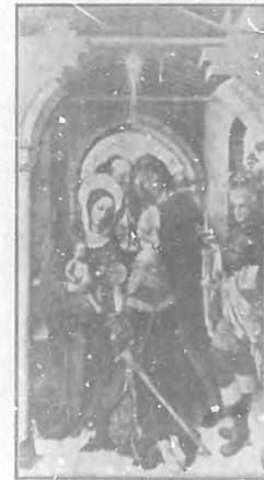
Adoración de los Reyes. Cuadro de la Escuela de Castilla del siglo XV.