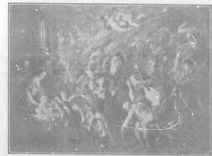
Adoración de los Reyes.—Cuadro de Pedro Pablo Rubens.