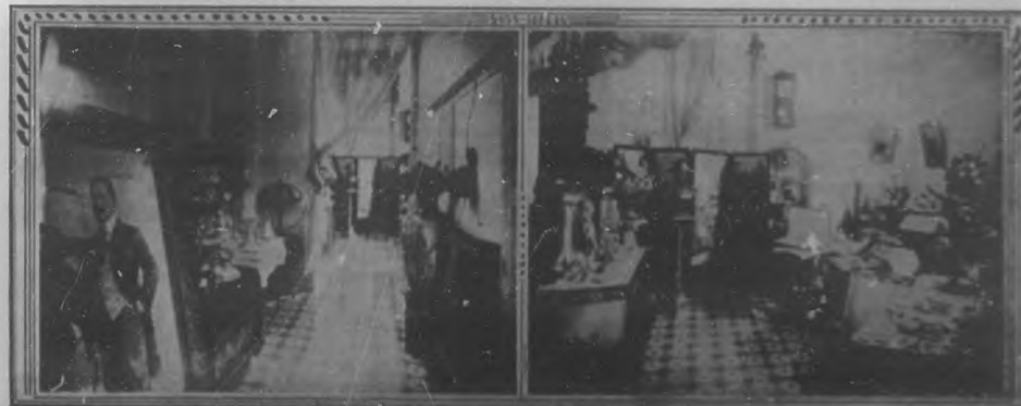
Dos aspectos de las habitaciones conteniendo regalos hechos á los esposos Pérez-Ledón.

Modelo del jardín "El Clavel", en cuya confección entraron las más lindas, las más frescas, las más fragan-